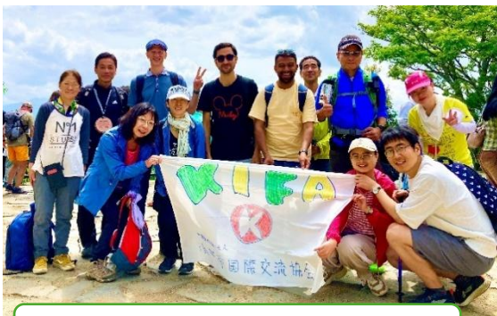
高尾山ハイキング