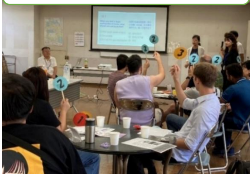
多文化カフェ③防災クイズ