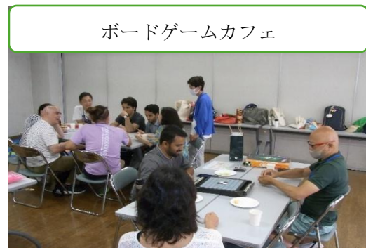
ボードゲームカフェ